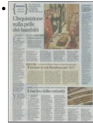
Copia di Copia di 20120228ladigePAGINACULTURA