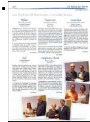
Enrico Gasperi artisti del giorno ottobre 2008