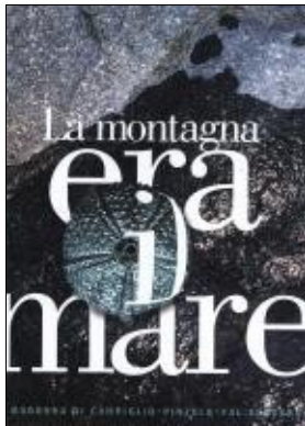
Enrico Gasperi la montagna era il mare, 2003