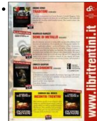
Enrico Gasperi Trentino mese aprile 2006