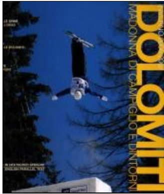
dolomiti copertina n. 1