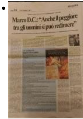
Copia di MDC. Anche il peggiore degli uomini si puo' redimere