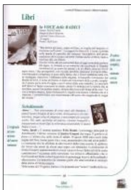
Enrico Gasperi paese in piazza n. 13