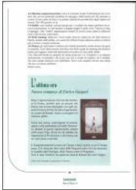
Enrico Gasperi paese in piazza n. 8