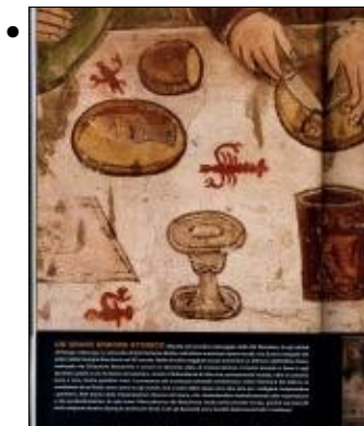
meridiani particolare articolo