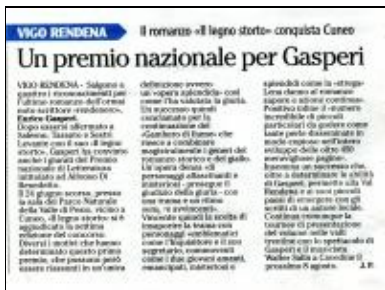
Enrico Gasperi 20120801ladige