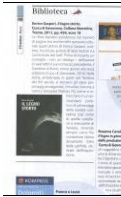
Enrico Gasperi Copia di il trentino - mensile- 2012 marzo