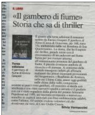
Enrico Gasperi 20101110 Corriere del Trentino