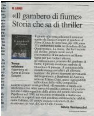
Enrico Gasperi 20101110 Corriere del Trentino