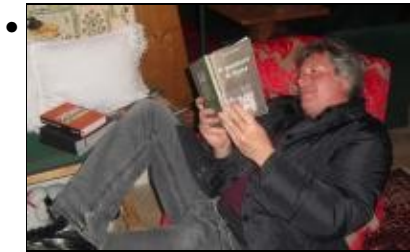
in pieno relax