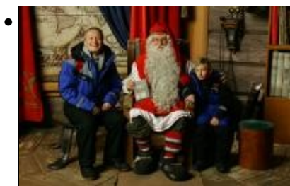
in casa di Santa Claus a Rovaniemi