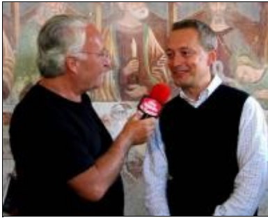
tra i gamberi