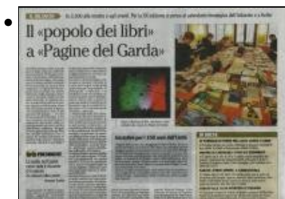
Enrico Gasperi un fotografo rapito dalla bellezza della copertina