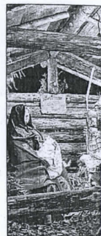
Un presepe a D